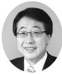
72代議長 北城 貞治