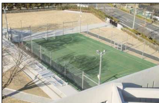
フットサル・テニス兼用コート