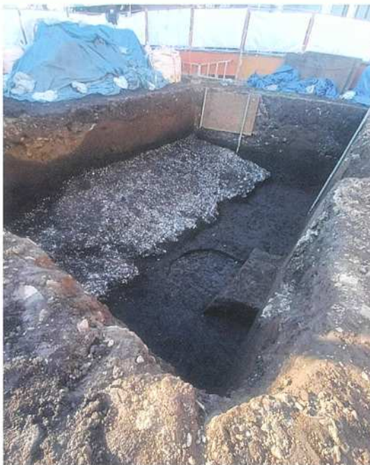
写真2 貝層(左) 縄文時代の土器片を多く含む層(右)