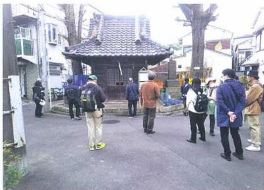
図3 下尾久石尊前の道

とには確定できないが、一行は第二の古墳カーブ発見(の可能性)の喜びを分かちあったのだった。 (亀川泰照)