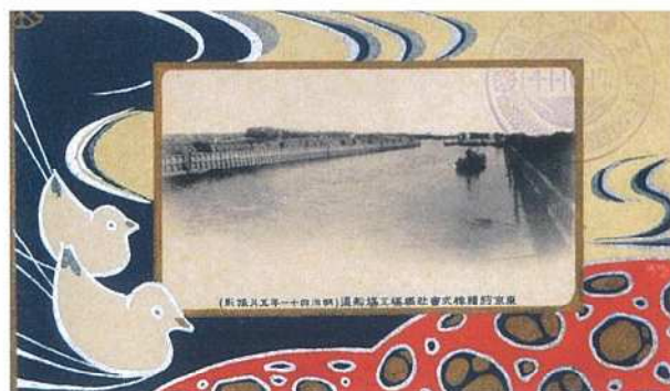
写真2 絵葉書「東京紡績株式会社橋場工場船渠(明治四十一年五月撮影)」

令和5年度の館蔵資料展「古写真でみる近代あらかわ」(2月17日〜3月31日)では、明治から昭和初期のあらかわの古写真を展示した。今回のこぼれ話は、南千住八丁目、汐入にあった紡績工場の絵葉書を取りあげたい。汐入を空から見たら、まずは汐入を空から見てみよう。左は隅田川沿いの鉄道施設・工場群(現南千住三・四・八丁目)の昭和初期の空撮写真で