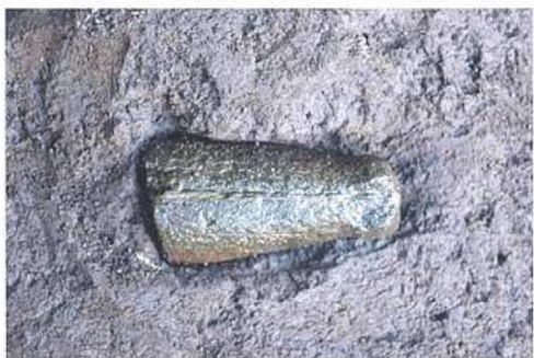
写真4 区内で初めて出土した石棒(部分)