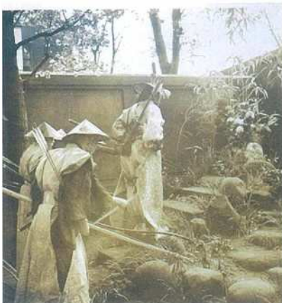
写真3 山吹の塚を訪れた区長一行