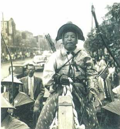
写真2 道灌に扮した区長と武者行列