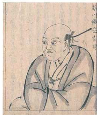
写真2 「先哲像傳」

養福寺も同様のはずだが、墓域に入ると異彩を放つ墓が目飛び込んできた。伊豆石製の三段