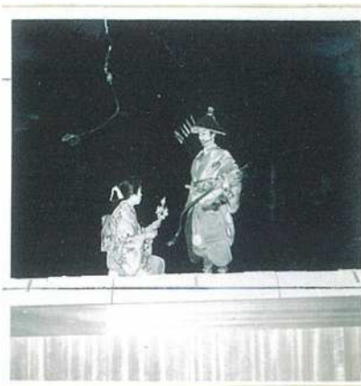
写真1 山吹の里伝説の劇

まつりは開都五百周年記念と銘打たれ、15日間にわたって盛大に開催されました。50年前は長祿元年（一四五七）に当たる室町時代。開都とは、江戸城の築城を意味していま