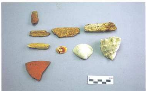
写真3 出土した貝、動物の骨など