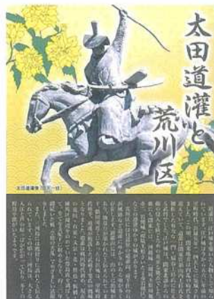
写真4 荒川区観光振興課パンフレット「太田道灌と荒川区」

す。つまり、築城を指揮した道灌が、まつりを盛り上げる主役として選ばれたのです。道灌は東京都の礎を築いたイメージキャラクターとして、都電荒川線の花電車に飾られた人形や、バッジや煙草のパッケージ等の記念グッズのモチーフになりました。