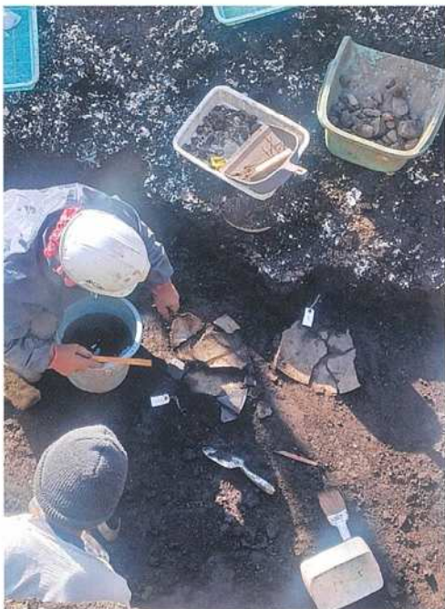
写真1 本発掘調査風景