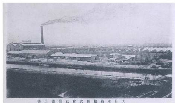
写真3 絵葉書「大日本紡績株式会社橋場工場」

ある(写真1)。「日本地理風俗大系Ⅲ」(新光社、昭和6年)に掲載され、東京の密集工業地帯を表す写真の一つとして紹介されている。写真上部中央、隅田川に面した一画(ア)が、大日本紡績株式会社である。大煙突が一本そびえ立つのが確認できる。その左側の区画(イ)は、東京毛織物株式会社及び日本石油株式会社隅田川油槽所である。中央の櫛の歯状の線路がある場所(ウ)は、隅田川貨物駅(現隅田川駅)。その下(エ)は千住瓦斯製造所(現東京ガス千住事業所)。隅田川を隔てて鐘ヶ淵紡績株式会社(現墨田区)の一部(オ)が見える。なお、右下の森(カ)が旧石浜神社社地である。