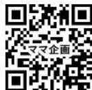
R03 あらかわ ママ企画講座