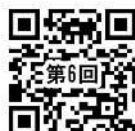
R03 家庭教育 乳幼児 第6回