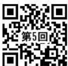
R03 家庭教育 乳幼児 第5回