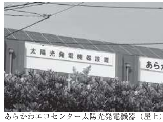
あらかわエコセンター太陽光発電機器(屋上)

・ドーナツ通りにおける自転車走行空間の創出に係る社会実験 ・不燃ごみ中継所(尾竹橋清掃作業所)の廃止 ・荒川区都市計画マスタープラン策定における中間報告 ・指定管理者候補者の選定(区民住宅) ・指定管理者候補者の選定(南千住駅東口自転車等駐車場・セントーまちや自転車駐車場) ・荒川三丁目(仲町通り商店街付近)浸水対策工事の実施 ・都市計画道路補助第107号線(千住間道)に係る土地収用裁決