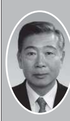
鳥飼 秀夫 (自民党)