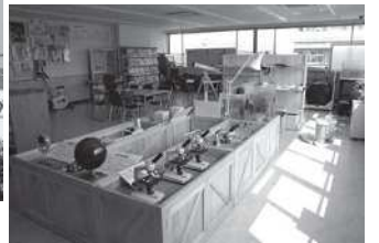
あらかわエコセンター環境実習室

2月4日 【議案審査】 23件 【所管調査事項】 ・特別養護老人ホーム整備予定地における土壌調査 ・その他 ・第4期荒川区高齢者プランの中間のまとめ(案) ・第2期荒川区障害福祉計画の素案 ・第2期荒川区障害福祉計画の素案