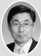
相馬 堅一 (共産党)