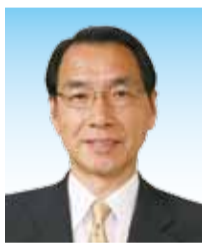
議長 志村 博司