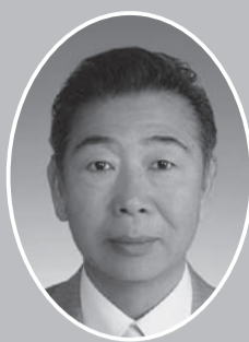
鳥飼 秀夫 (自民党)