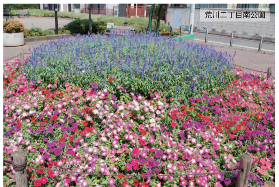
荒川二丁目南公園