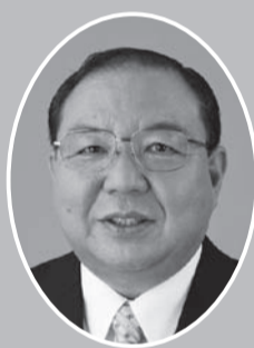
中村 尚郎 (公明党)