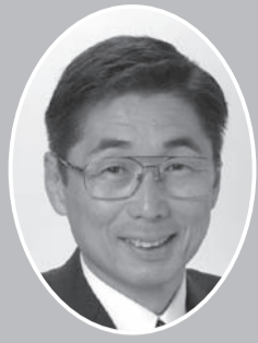
相馬 堅一 (共産党)