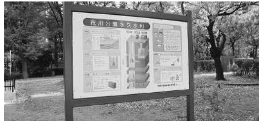
荒川公園永久水利

【調査研究事項】 ・治安の更なる向上に向け重点的に実施する対策 ・特殊詐欺撲滅へ向けた取り組み ・平成27年度夏の省エネ・節電対策 ・東京女子医科大学東医療センターの移転計画