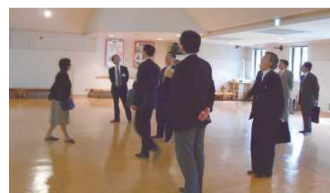
▲視察風景（上野小学校複合施設）