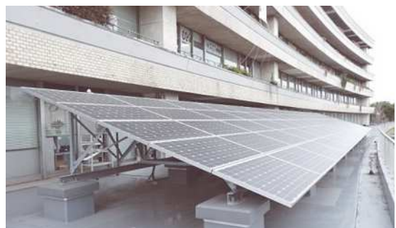
▲荒川区役所の太陽光パネル