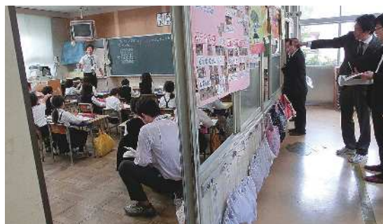
▲視察風景（市立徳山小学校）