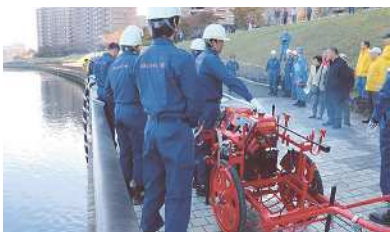
◀ 隅田川からの永久水利