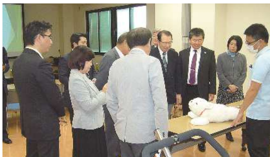
▲視察風景（介護ロボット体験）