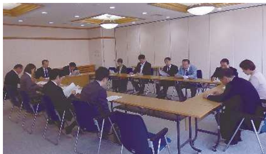
▲視察風景（グリーンパール那須）