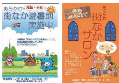
▲省エネ節電対策ポスター