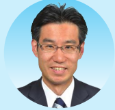
しみず ひろし 清水 啓史 (民進党)