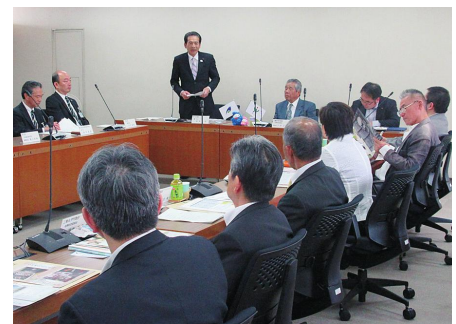
▲三重県津市議会 様