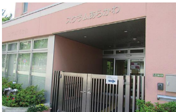
◀町屋地区の障がい者 地域生活支援施設