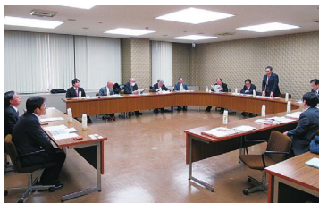
◀三重県津市での研修の様子