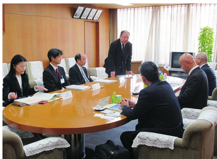
▲兵庫県篠山市議会 様