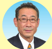
はっとり としお 副 服部 敏夫 (自民党)