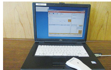
◀当日投票システムパソコンのイメージ