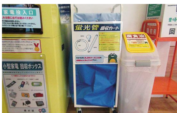
◀蛍光管回収カート