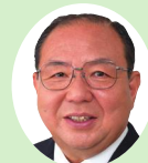
副議長 中村 尚郎