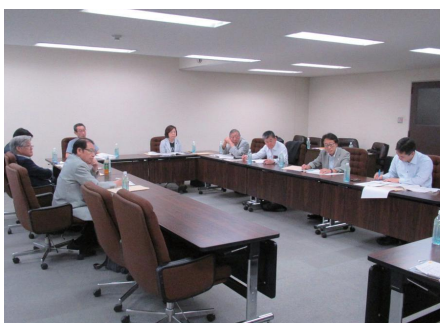
▲宮城県仙台市での研修の様子