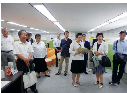
▲マザーズハローワークでの研修の様子