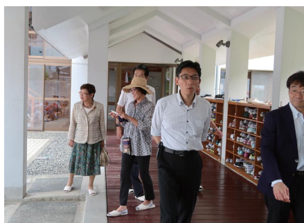
▲下田臨海学園での研修の様子