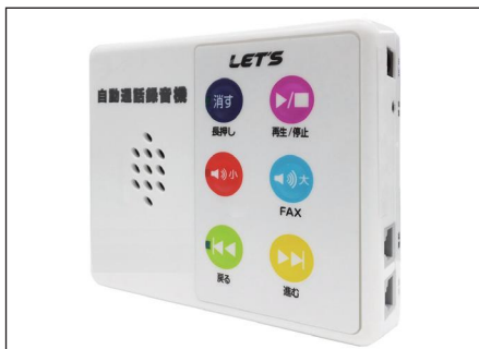
▲電話機に取り付ける電話自動通話録音機