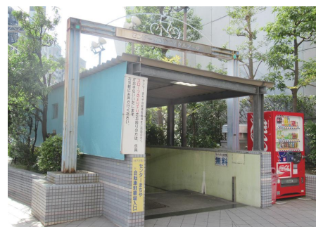
▲センターまちや自転車駐車場