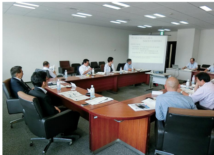
◀福島県福島市での研修の様子