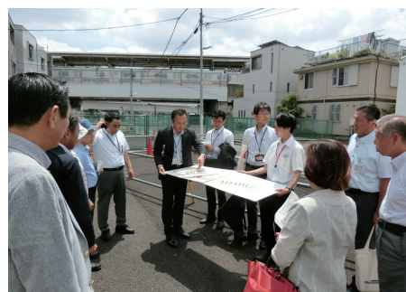
◀区内での研修の様子