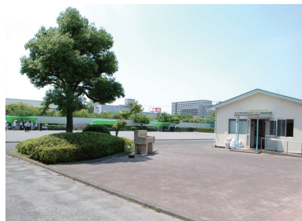
◀荒川区営東尾久運動場