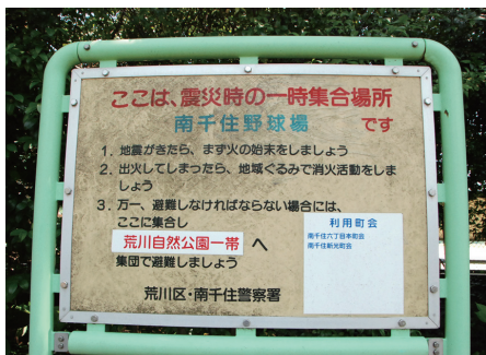
◀避難所を示す看板