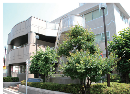
◀調査対象団体の一つ 荒川区シルバー人材センター