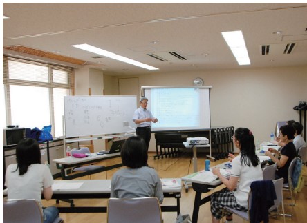
◀手話講習会の様子