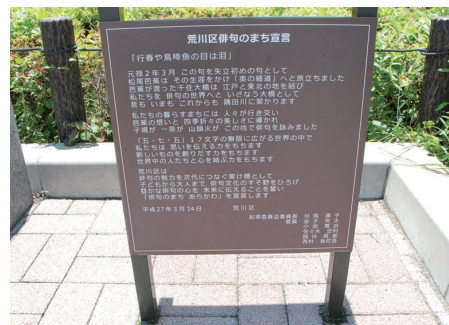
◀荒川区俳句のまち宣言の看板