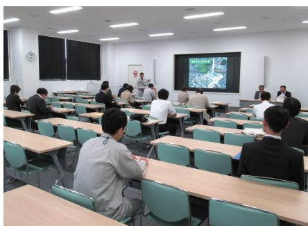
◀練馬清掃工場での研修の様子