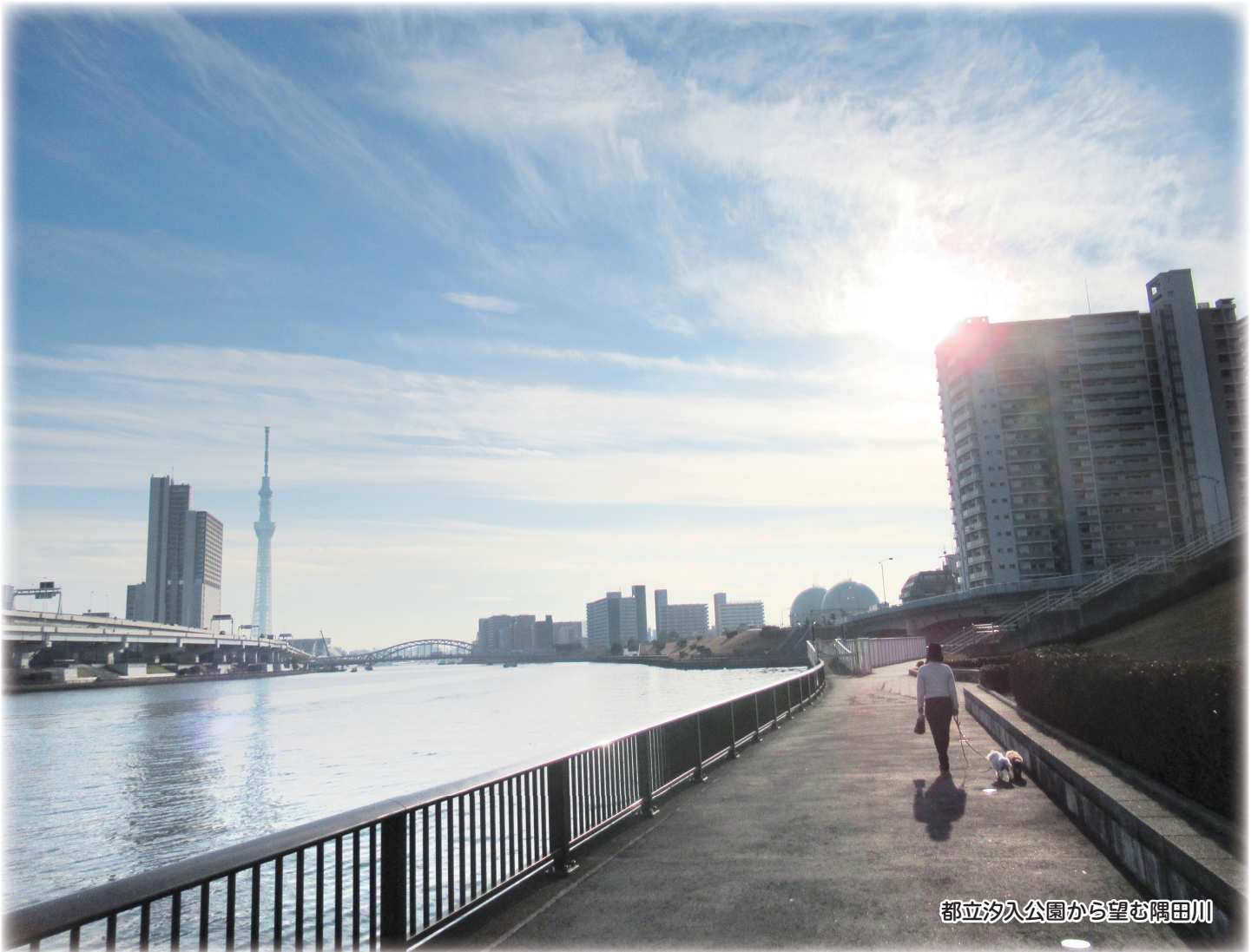
都立汐入公園から望む隅田川