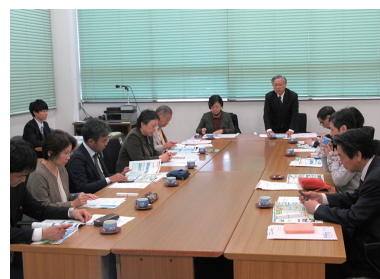
▲長崎県長崎市にて 研修の様子