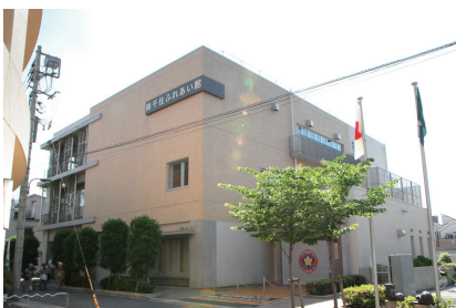
南千住ふれあい館

答 サークル団体がふれあい館の予約が取れない等の事案については、可能な限り、曜日や時間、他のふれあい館等への変更をお願いし、ご理解とご協力を頂くように努めているところである。