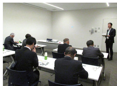
◀ 静岡県焼津市議会様