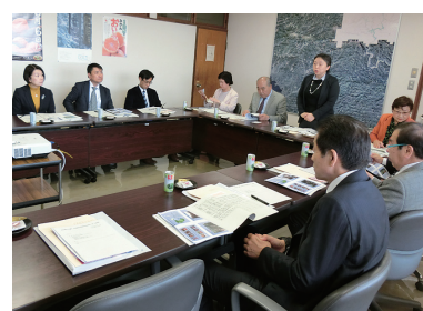
◀和歌山県田辺市にて研修の様子