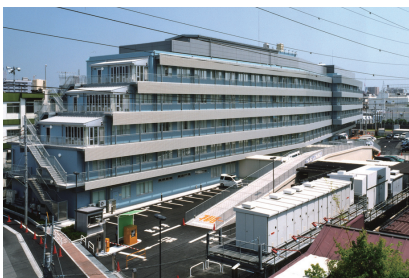
東京女子医科大学東医療センター移転後の災害拠点病院誘致について

答 医療機関の誘致に当たっては、しっかりとした財政基盤と経営戦略を持ち、大学病院等と確実な連携関係を有し、災害時も含め高度で良質な医療が提供できる医療機関を選ぶことが絶対条件と考えている。公募要項等についても、このような考えに基づき、専門家の意見も聞きながら作成し、公募を開始した。引き続き全力で取り組んでいく。