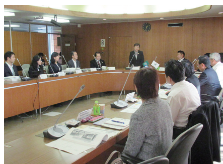
◀ 滋賀県彦根市議会様