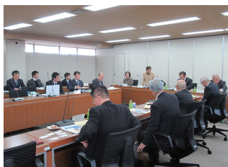
◀ 滋賀県蒲生郡町村議会議長会様