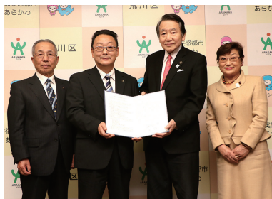
◀潮来市との災害時相互応援に関する協定締結の様子