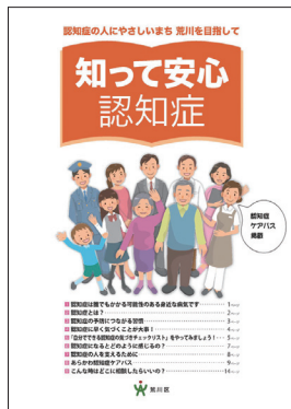
区役所等で配布されている認知症に関する情報冊子

答 区民が参加しやすい検査や回復のための事業について調査研究を行うとともに、認知症の予防や発症を遅らせると言われるバランスの良い食生活や運動習慣等の知識の普及を進めていく。