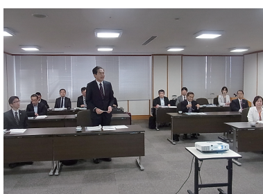
◀大阪府堺市にて研修の様子