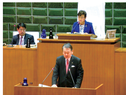
▲本会議での区長答弁の様子

12月緊急会議が開かれました。この緊急会議では、議案4件が区長から提出され、いずれも原案どおり可決されました。