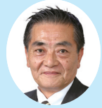
さいとう やすのり 斎藤 泰紀 (自民党)