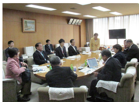
◀ 埼玉県ふじみ野市議会様