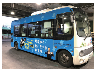
◀区内を走るオレオレ詐欺被害防止のラッピングをしたコミュニティバス