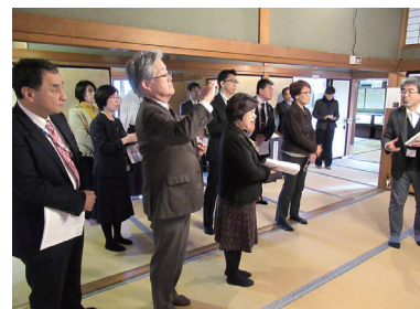
◀「ばーと◎とやま」にて研修の様子