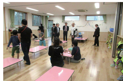
◀ 汐入東小学童クラブへの視察の様子

答 区としては、学童クラブの運営にあたり、子どもの安全等の質を確保することは最も重要であると認識しており、現時点においては、今回の国の方針を受け、放課後児童支援員の資格要件や配置人数を見直すことは考えていない。