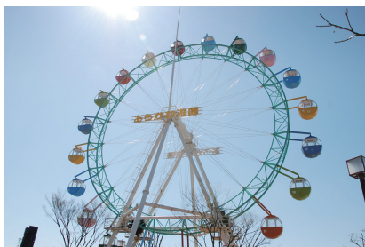
リ ニ ュ ー ア ル 工 事 の た め 現 在 休 園 中 の あ ら か わ 遊 園

答 区としては、多様な媒体を最大限活用し、宣伝効果を最大限に高められるよう、広報戦略を検討していく。また、待ち時間を快適にお過ごしいただけるような工夫や、待ち時間の短縮につながる対応可能な取り組みも含め、来園者がより快適に荒川遊園をご利用いただける管理・運営方法について検討していく。