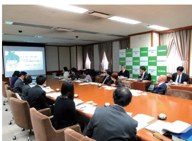
▲愛知県名古屋市にて 研修の様子