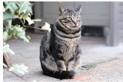
区内の飼い主の猫の様子

答 どのような対策を講じることが有効であるかについて、関係部署と連携しながら検討していきたいと考えている。