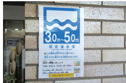
荒川氾濫時の想定浸水深を示す掲示

答 今後とも、大規模水害発生時に区民が的確な避難行動がとれるよう意識啓発を強化していく。