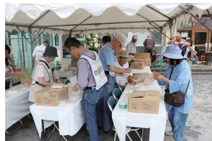
避 難 所 開 設 ・ 運 営 訓 練 の 様 子

答 地域防災計画の修正や地域防災計画実施推進計画の策定など、着実に対策を推進している。様々な災害の危機が迫る中、区の地域力を最大限に活かし、自助、共助の啓発と支援に努めるとともに、区の防災対策を全力で推進していく。