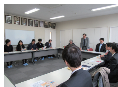
◀旭川育児院にて研修の様子