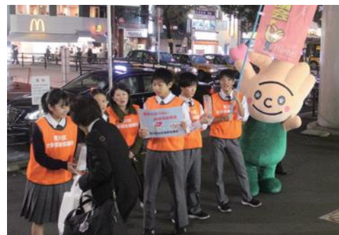
▲調査対象団体の一つ荒川区社会福祉協議会の活動の様子(歳末たすけあい・地域福祉募金)