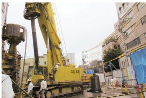
▲(仮称)日暮里活性化施設の工事の様子