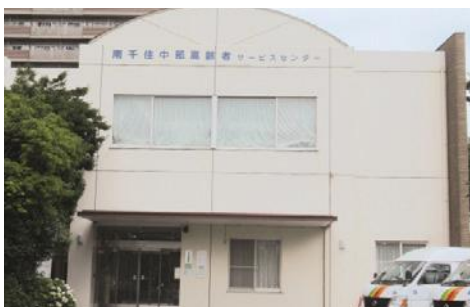
▲南千住東部地域包括支援センターの移転先 (南千住中部在宅高齢者通所サービスセンター)