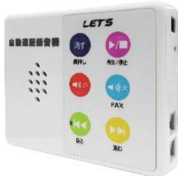
▲電話機に取り付ける電話自動通話録音機