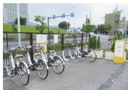
▲シェアサイクル実証実験中のサイクルポート