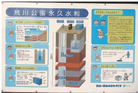
▲あらかわ公園内の永久水利施設