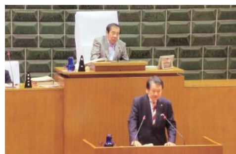
◀6月会議の区長答弁