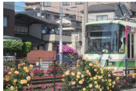
▲都電のまちあらかわ