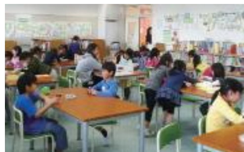
▲にこにこすくーるの様子