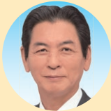
正 保坂 正仁 (公明党)

総務企画部、区政広報部、管理部、産業経済部、会計管理部、選挙管理委員会及び監査委員に関する事項並びに他の委員会の所管に属しない事項