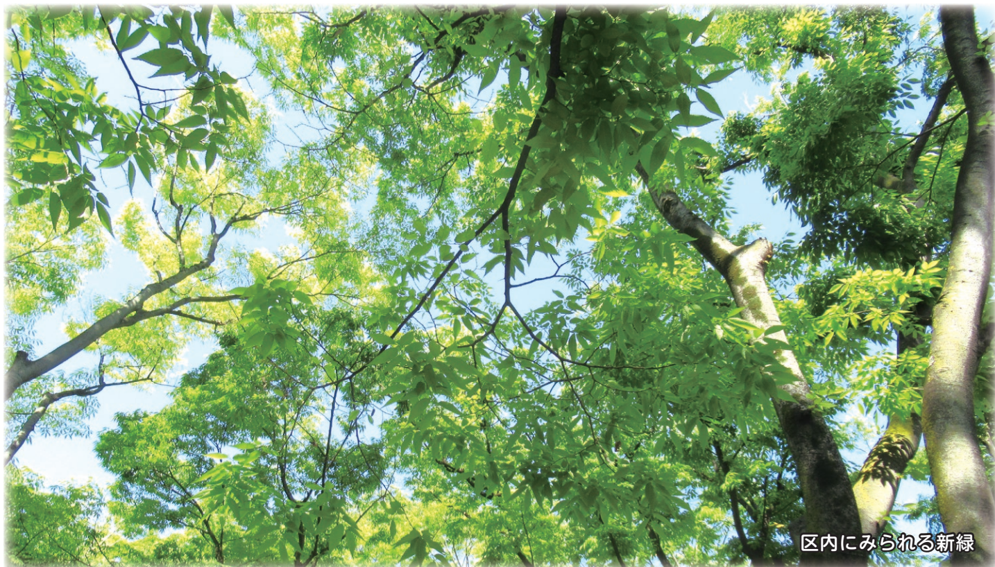
区内にみられる新緑