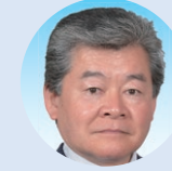
中島 義夫 (自民党)