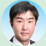
久家 繁 (立憲民主党)