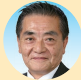
副 斎藤 泰紀 (自民党)