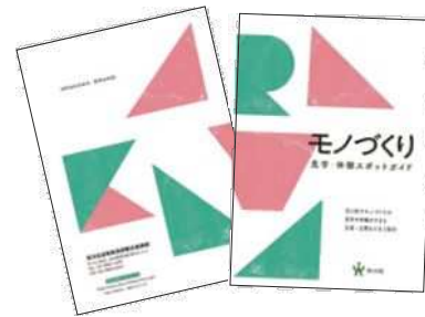
◀モノづくり見学体験スポットガイド▶

答 区内全域での外国人旅行者の実態把握については、今後、その必要性について慎重に検討する。