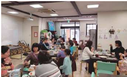
◀ 地域食堂で交流しながら食事を楽しむ様子

答 計測器を活用した健康チェック、介護予防プログラムや交流事業を定期的で開催しており、今後も高齢化が進むことを想定し、フレイル予防の一層の推進を図っていく。