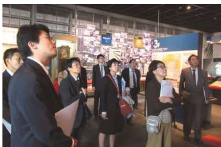
▲人と防災未来センターにて研修の様子