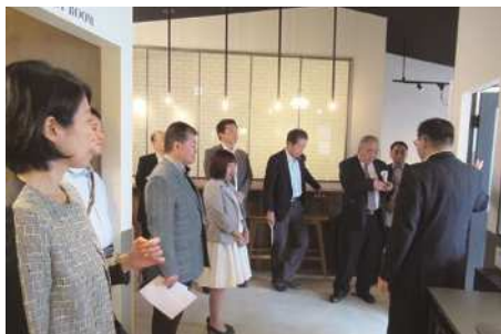
▲COSA ON(コーサオン)にて研修の様子