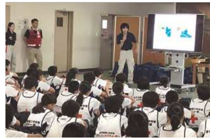
講習を受講するレスキュー部員たち