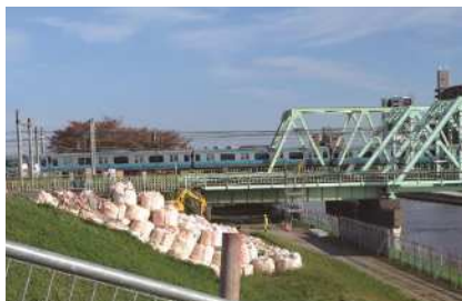
↑ 工事 中の JR 東北 本線 荒川 橋梁 周辺

答 橋梁周辺の工事は、鉄道への影響を考え慎重な施工となるが、区としても洪水の危険性を取り除く重要性は認識しており、着実かつ早期に工事の進捗が図られるよう、国に要望していく。