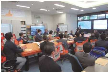
▲荒川知水資料館アモアにて視察の様子

○荒川知水資料館アモア・荒川下流河川事務所 新岩淵水門、JR東北本線荒川橋梁等における 現状について