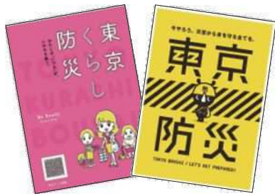
◀防災マニュアルの数々

答 自主的又は緊急的にふれあい館等へ避難することを想定し、従事職員が必要な支援を行う。