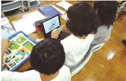
▼プログラミング教育の授業風景

答 小学校学習指導要領では、プログラミング教育により、コンピュータ等を上手に活用して身近な問題を解決したり、より良い社会を構築する態度を育むことを目標としている。