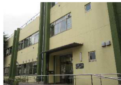
◀ 児童発達支援を行う 荒川たんぽぽセンター

答 区行政全体として、様々な特性の発達障害に対し、より緊密で強固な連携を図る必要がある。早期発見・早期療育からその後の継続的支援まで、一貫して寄り添う連携体制を強化し、医療機関へ確実につなぐ仕組みづくりやかかりつけ保健師による切れ目のない支援など、各部署一丸となり取り組む。福祉部では、たんぽぽセンターが区立施設として果たすべき役割を見極め、人材確保・定員拡大を含め、質の高い療育の実施を目指す。教育委員会では、より適した教育環境で成長できるよう、一人ひとりの発達に応じた教育の充実に努める。子育て支援部では、関連部署と綿密な連携を図り、支援補助員の配置や心理の専門家の巡回を行っており、今後も運営体制の充実に努める。