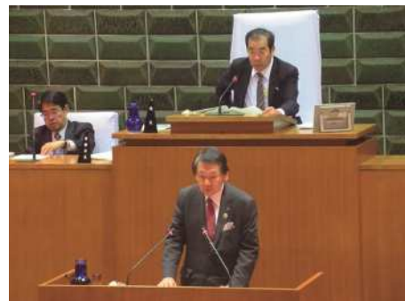
◀本会議での区長答弁の様子

11月会議では、議員から提出された議案2件と区長から提出された議案15件がいずれも原案どおり可決されました。