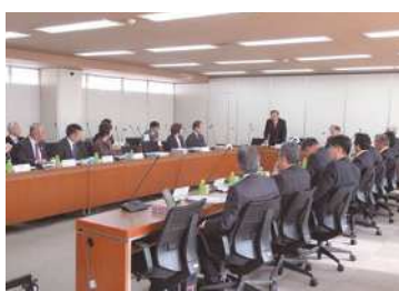
◀広島県府中市議会様