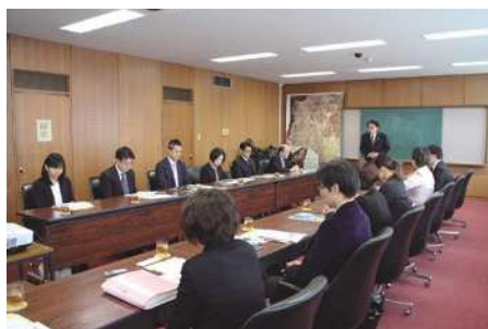
▲愛媛県松山市にて研修の様子