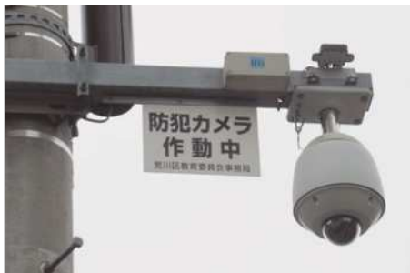
▲区内に設置されている防犯カメラ