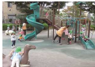
◀子ども達が公園で元気よく遊ぶ様子

答 幼児期から運動能力の向上を図ることが、社会に出て自立するスキルを身に付けるという視点からも重要であると認識している。幼稚園・保育園においても楽しみながら身体を動かす遊びを通して幼児の体力向上を図るべく、なお一層の取り組みに努めていく。