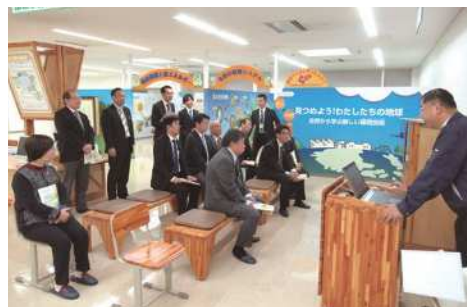
▲釧路広域連合清掃工場にて研修の様子