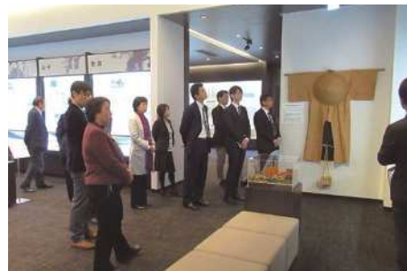
▲奥の細道結びの地記念館にて研修の様子