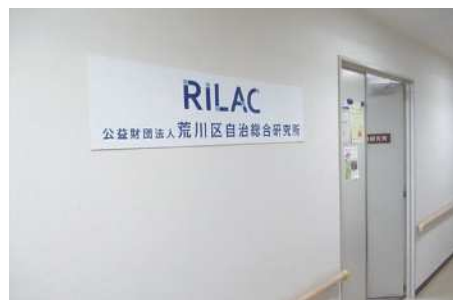
▲荒川区自治総合研究所