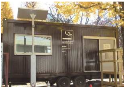
受動喫煙防止措置のために設置した屋外喫煙所

答 法令の周知や苦情相談、健康教育等に取り組むと同時に、民間事業者との協働による分煙環境の整備に向けた取り組みなどを一層進めていく。