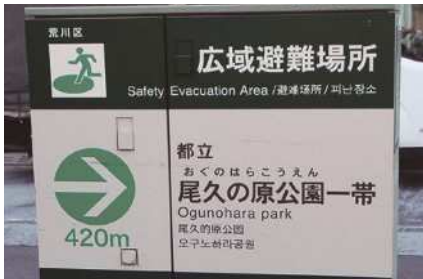
区内にある避難場所表示看板

答 外部の危機管理研修なども活用し、職員の育成を推進する。避難所ごとに複数の担当職員を指定し、必要な体制を組んだ上で、運営訓練等を通して各町会とも顔の見える関係を築きながら、避難場所の運営に関するスキルを向上させていく。