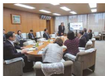
◀宮城県仙台市議会様