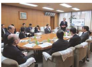
◀福岡県北九州市議会様