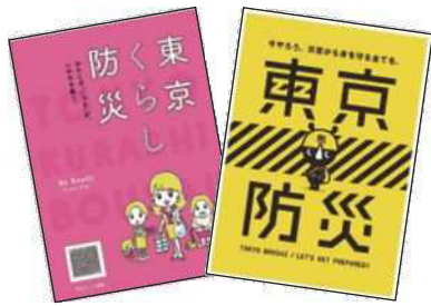
◀防災マニュアルの数々

答 自主的又は緊急的にふれあい館等へ避難することを想定し、従事職員が必要な支援を行う。