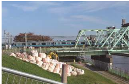
↑ 工事中の JR東北本線荒川橋梁周辺

答 橋梁周辺の工事は、鉄道への影響を考え慎重な施工となるが、区としても洪水の危険性を取り除く重要性は認識しており、着実かつ早期に工事の進捗が図られるよう、国に要望していく。