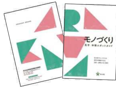
◀モノづくり見学・体験スポットガイド▶

答 区内全域での外国人旅行者の実態把握については、今後、その必要性について慎重に検討する。