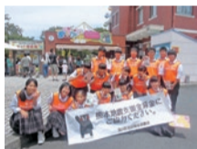
熊本地震支援募金活動

熊本地震支援募金活動にも参加しました。来園者の皆さんには、避難所で暮らす方への応援メッセージを書いていただき、温かい心に触れることができました。