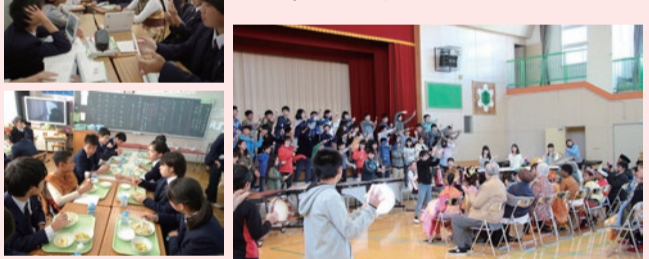
給食を食べながら英語で交流 ▲尾久西小でのセレモニー