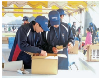
荒川リバーサイドマラソン