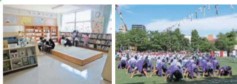
量がおおむらぶック ▲芝生で踊る四峡ソーラン