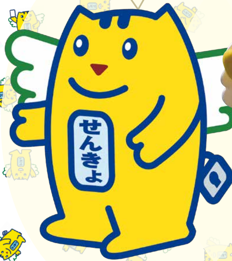
イラスト版めいすいくん