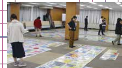
審査員ごとの審査

下描きをしっかりとすることがわかるし、自分で考えて描いたことが伝わってきます。有権者の様々な思いが込められた一票を色とりどりの風船に見立てるなど、独創的な表現による作品となっています。