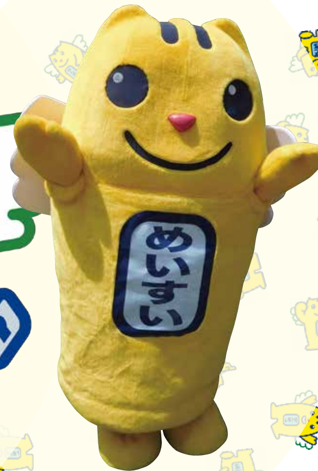
啓発活動版めいすいくん