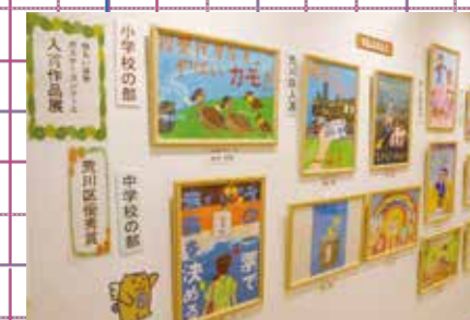
ゆいの森あらかわでの展示