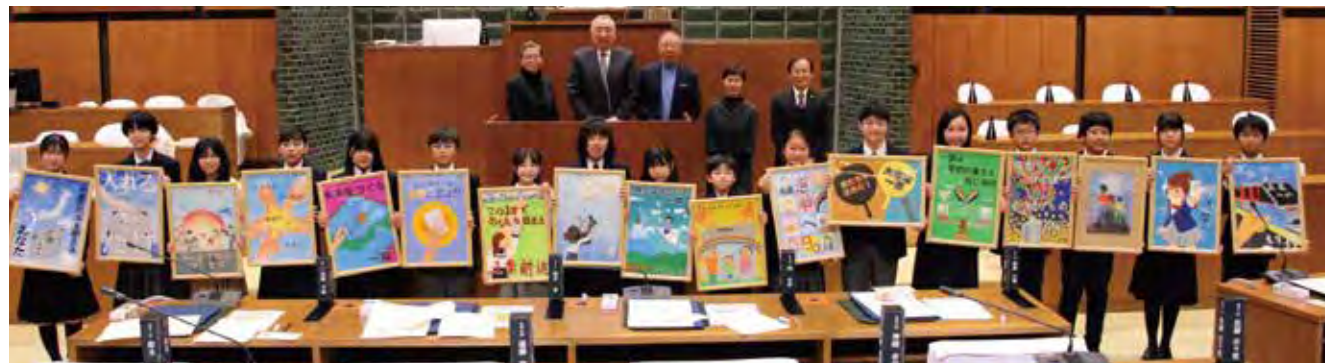
受賞者みんなで、記念写真（荒川区議会議場にて）

明るい選挙ポスターコンクールは、公益財団法人明るい選挙推進協会が毎年、全国の児童・生徒の皆さんを対象に実施しており、今年度で第75回目を迎えます。荒川区では、教育委員会や各学校の協力を得ながら毎年6月頃に募集し、9月までに選挙管理委員会にお寄せいただいています。