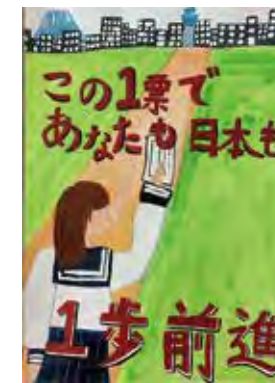
関 更紗 (汐入小5年)