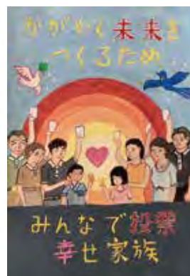
神崎 杏奈 (瑞光小6年)