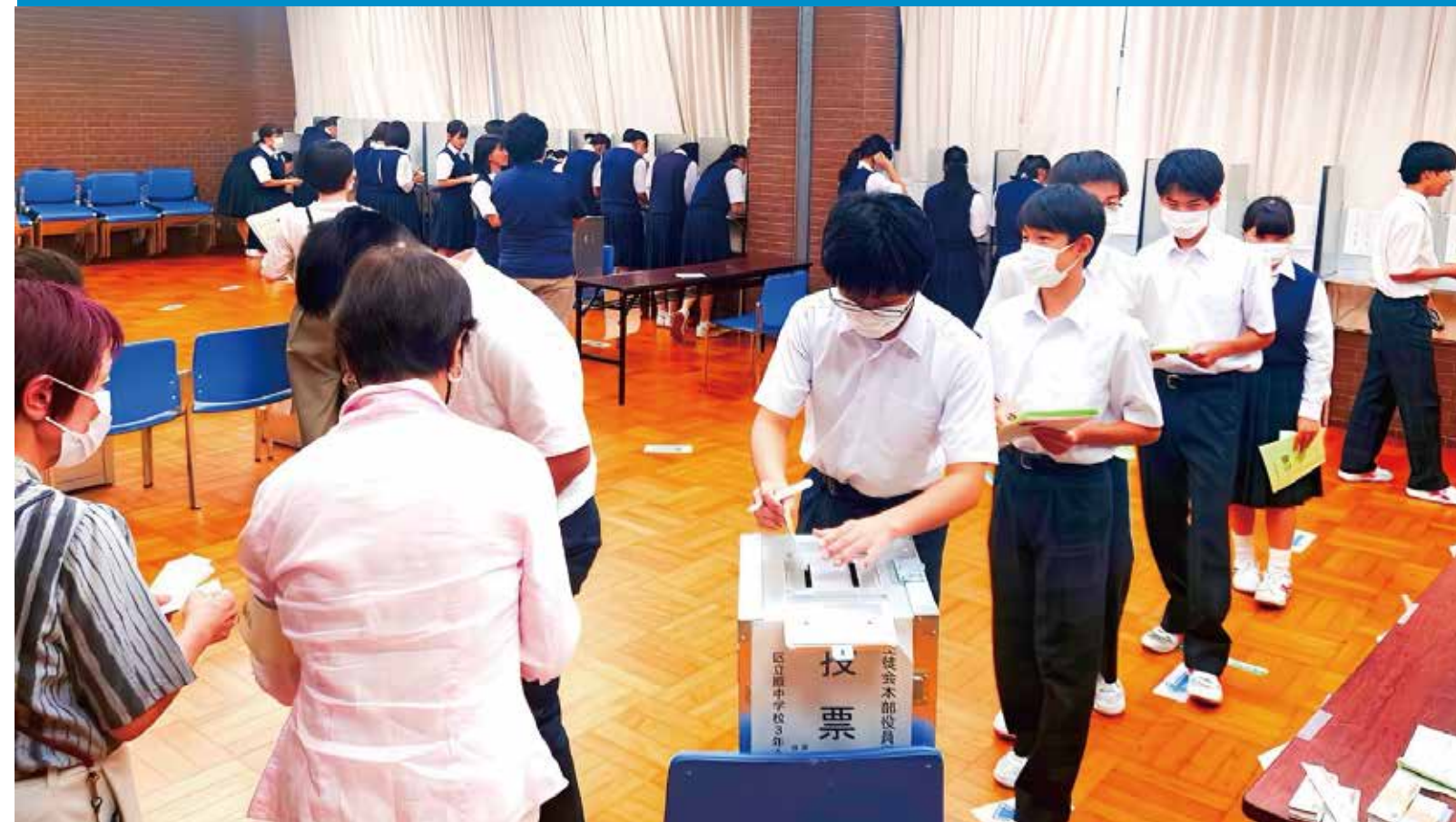
生徒会役員選挙を全面応援（令和5年9月15日 区立原中学校）

Era·vote「えらぼうと」は 選ぼうとvote(投票する)を組み合わせた造語です