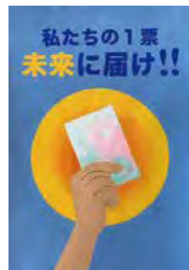
近藤 亨昭 (第三中1年)