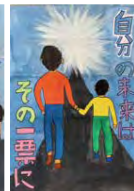
遠藤 智喜 (六瑞小6年)