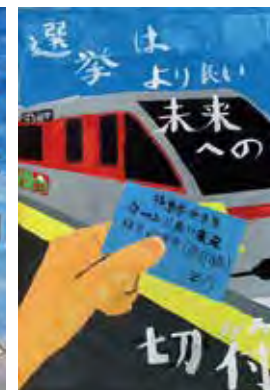
高木 暖人 (原中2年)