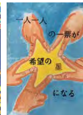
関口 結佳理 (原中2年)