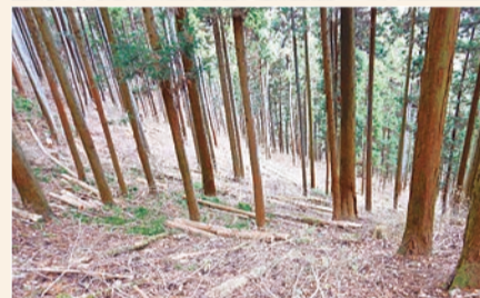
間伐と実施後の森林の様子