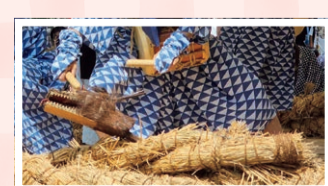
おたたくごんじょうじ 大田区厳正寺に伝わる藁の竜

藁の竜は、姿を消してしまったけれど、周辺が農村だったころのあらかわの歴史を伝えてくれているんだね。えっ! 竜はアニメや昔話などにも登場するし、お神輿や山車にかっこいい竜が彫られているのを見た? よく観察しているね。神社や寺院、街中を探検するとちょっと竜に出会えるかもしれないよ。みんなで