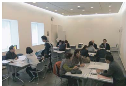
第2回相談会 会場の様子