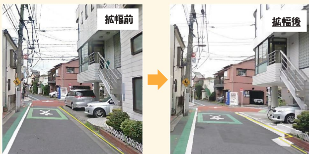
主要生活道路優先整備路線

「安全で安心して住み続けられる災害に強いまち」の実現に向けて、道路拡幅に取り組んでいます。