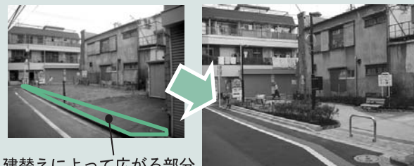
建替えによって広がる部分