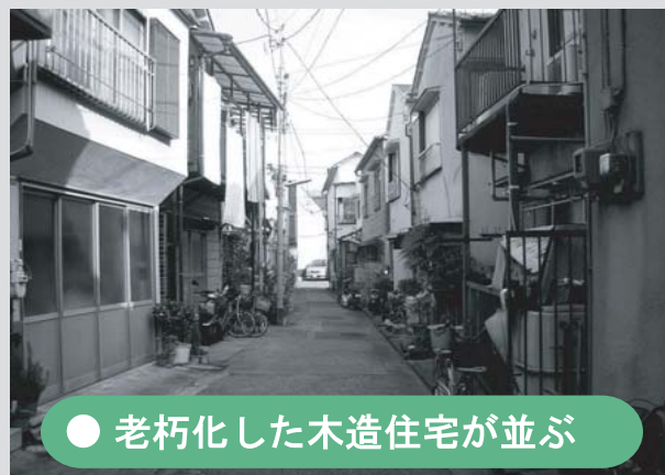
● 老朽化した木造住宅が並ぶ