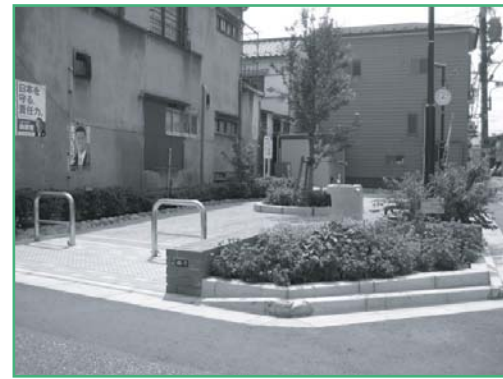
※ 整備イメージ（荒川五丁目グリーンスポット）