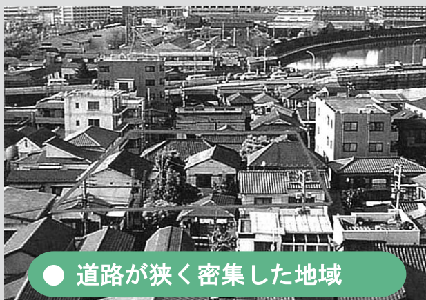
● 道路が狭く密集した地域

荒川五・六丁目地区は、古い建物が密集し、4m未満の幅員の狭い道路が多い地区です。