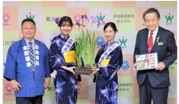
左から潮来市 原市長、あやめ娘(2人)、西川区長