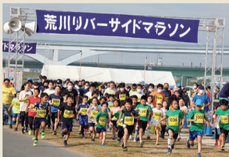
▲元気よくスタート！

区内在住・在勤・在学の小学1年生から80代までの方が参加し、秋空の下、2・3・5・10kmのコースを思い思いのスピードで駆け抜けました。小・中学生も多く参加し、沿道からの応援を受けながら走りました。