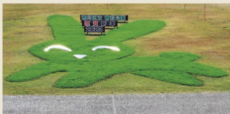
▲今年の干支、うさぎのアート