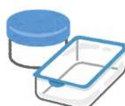
Đồ đựng bảo quản thực phẩm