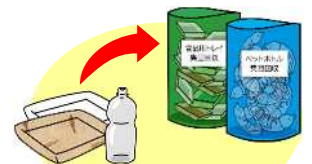
Chai nhựa PET, khay

Vứt chai nhựa PET và khay vào trong lưới giống như trước đây.