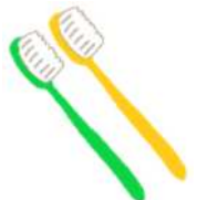
Bàn chải đánh răng