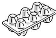
Khay đựng trứng