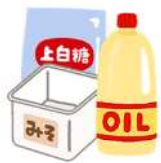
Đồ đựng gia vị, v.v.