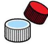
Nắp đậy các loại đồ đựng, v.v.