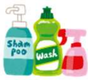
Đồ đựng chất tẩy rửa, v.v.