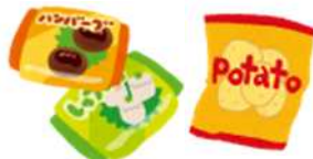
Túi đựng thực phẩm đông lạnh, bánh kẹo, v.v.