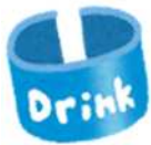
Nhãn chai nhựa PET

Túi đựng bánh kẹo là "Nhựa" nếu có mác nhựa (♻️) dù mặt trong túi là nhôm.