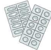
Vỉ đựng thuốc, v.v.