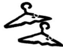
Móc treo bằng nhựa