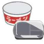
Hộp đựng cơm hộp Hộp đựng mì hộp