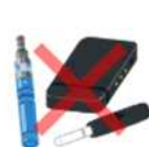
Thiết bị điện tử