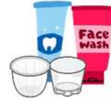
Các loại đồ đựng khác bằng nhựa