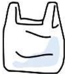
Túi nylon mua sắm