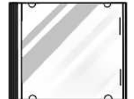
Vỏ đĩa CD/DVD